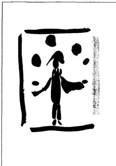
Herbert Leupin – Lithografie, 50 x 70 cm