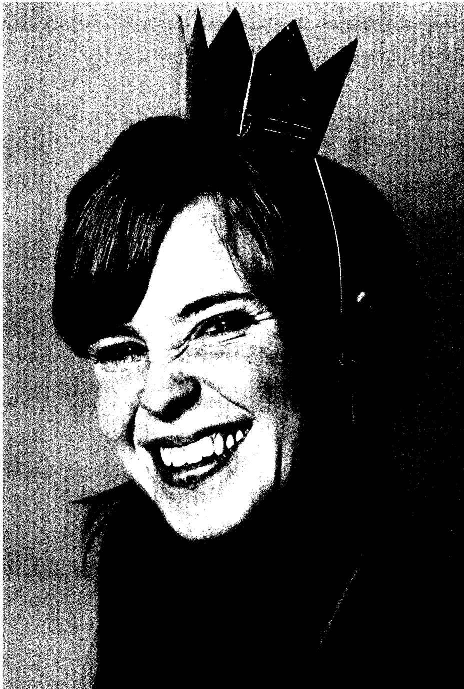
PHOTOCASE / KATRIN BPUNKT; BEARBEITUNG: GEHIRN&GEIST