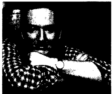
FOTOLISEN VON ECKHART VON HIRSCHHAUSEN