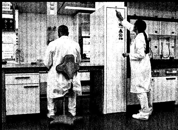
Laborfläche ist kostbar. Lesen Sie, wie Sie mit einem neuen Gefahrstoffschränk-Konzept Laborraum sparen können. Seite 22

Analysenreine Laborglas- aufbereitung mit der neuen Generation PG 85.