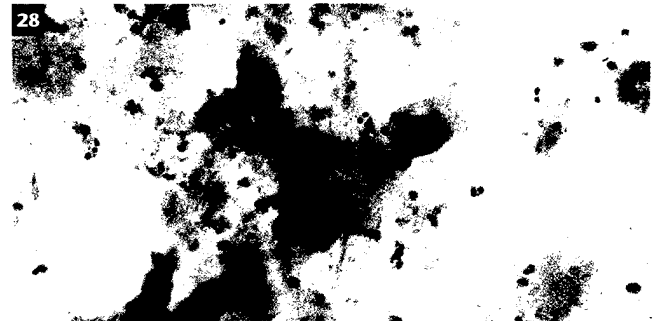
Humane Papillomaviren können zu Gebärmutterhalskrebs führen. Es gibt einige Verfahren zur Früherkennung.