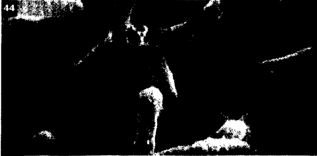
Die Aktinomykose ist eine seltene chronische Infektionserkrankung, primär durch Actinomyces israelii verursacht.