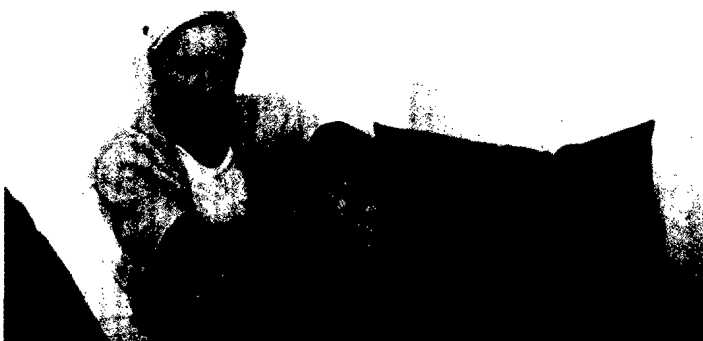
ILLUSTRATION: DANIEL LUDWIG