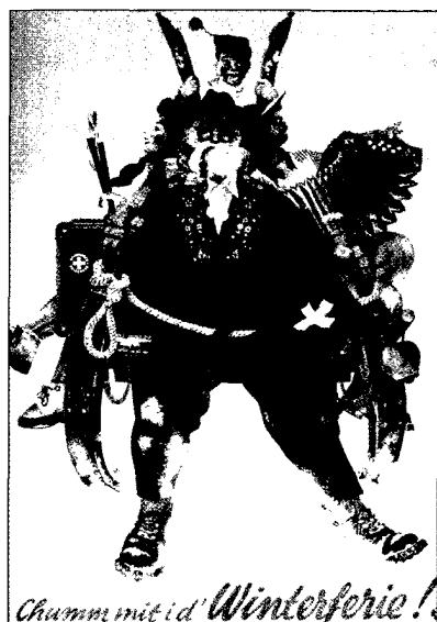
Herbert Leupin – Plakat für die Schweizerische Verkehrszentrale