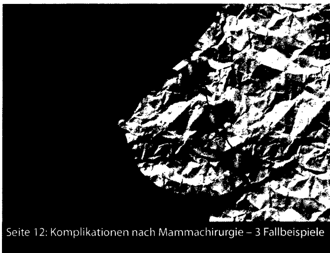
Seite 12: Komplikationen nach Mammachirurgie – 3 Fallbeispiele