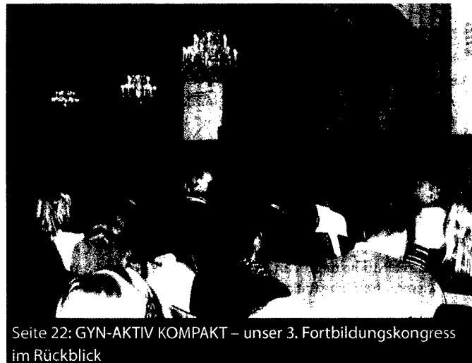
Seite 22: GYN-AKTIV KOMPAKT – unser 3. Fortbildungskongress im Rückblick