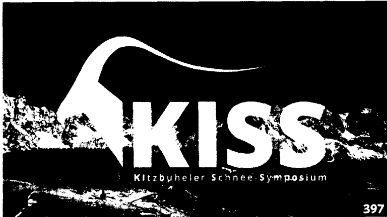
1. Kitzbüheler Schnee-Symposium (KISS): Exklusive Winter-Fortbildung