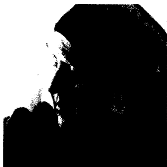
Was die Kältekappe für Patientinnen mit Chemotherapie wirklich bringt

durch punktgenaue und qualifizierte Informationen zu den neuesten Erkenntnissen der Medizin. Mit einem Abonnement der Gyn-Depesche erhalten Sie zusätzlich Zugriff auf die größte deutschsprachige Datenbank von Studienzusammenfassungen.