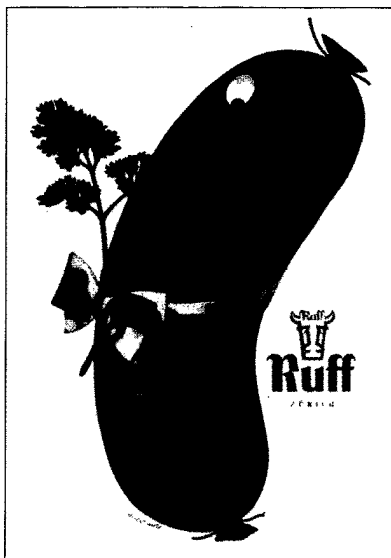
Herbert Leupin – Plakat, 1946

Die Abbildungen wurden uns freundlicherweise von der Collection Herbert Leupin zur Verfügung gestellt.