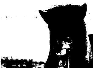
Islandpferd ( Equus ferus caballus )