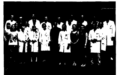
Arbeitsgruppe der Klinik für Psychiatrie und Psychotherapie III, Universitätsklinikum Ulm, Foto: ©Universitätsklinikum Ulm