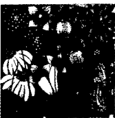
ARS MEDICI 10/16: Blumen (verkauft!)