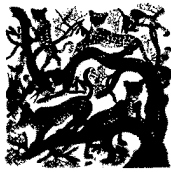
ARS MEDICI 12/16: Geparden auf Weiss (verkauft!)