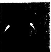
ARS MEDICI 11/16: Flamingos (verkauft!)