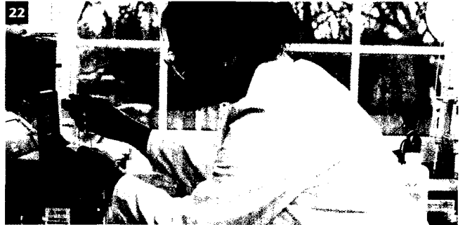
Methodenvalidierung: In dem Beitrag wird eine praktikable und dennoch richtlinienkonforme Methode beschrieben.