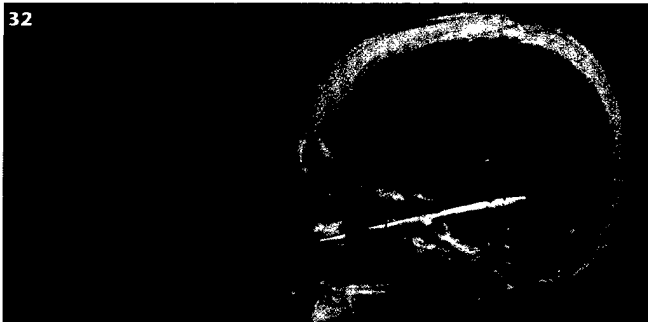
32 CT-Protoll Schädel: Häufige Indikationen, Vorbereitung, Patientenauflagerung, aktiver Strahlenschutz etc.