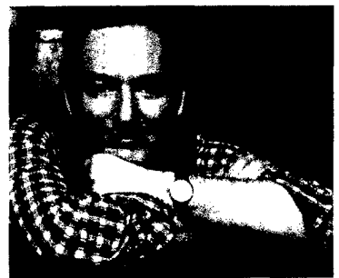
FRANK FIDEL / MIT FIDEL / GEN VON ECKART VON HIRSCHHAUSEN