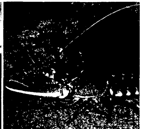
Materia Medica – Homarus