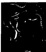
ARS MEDICI 8/16: Fische (verkauft!)