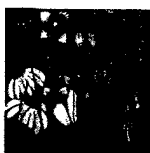
ARS MEDICI 10/16: Blumen (verkauft!)