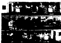
ARS MEDICI 7/16: Mütterberatung (verkauft!)