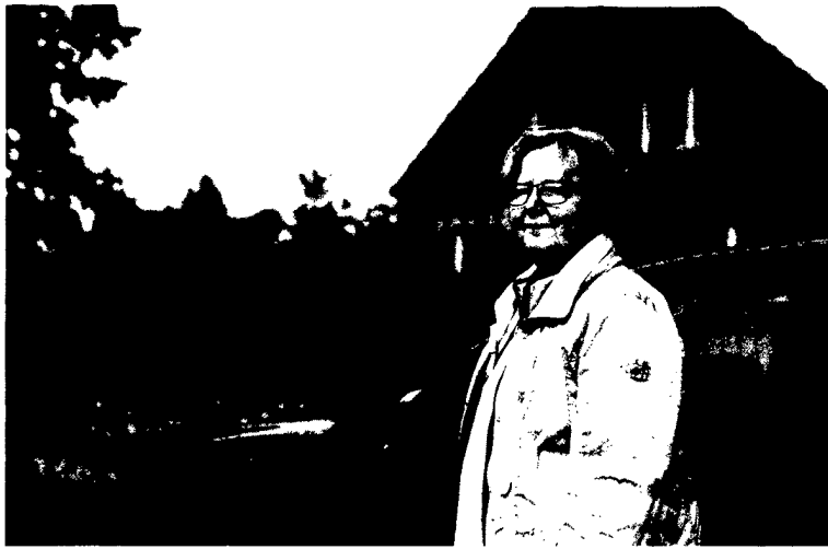
33 Leben Dorfcoaches: Kampf gegen die Ödnis