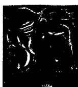
ARS MEDICI 8/16: Fische (verkauft!)