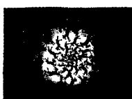
ARS MEDICI 9/16: Zebbras