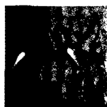
ARS MEDICI 11/16: Flamingos