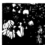
ARS MEDICI 10/16: Blumen (verkauft!)