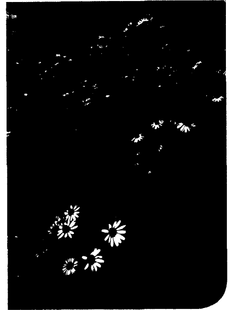
Titelfoto: Blühendes Feld