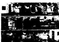
ARS MEDICI 7/16: Mütterberatung (verkauft!)