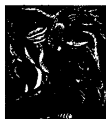
ARS MEDICI 8/16: Fische (verkauft!)