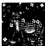
ARS MEDICI 6/16: Geparden und Vögel (verkauft!)