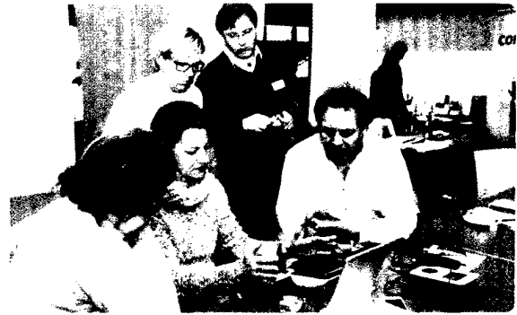
Professional Imaging, Surgery and Technique (PISTE) bot fünf Tage umfassende Fortbildung für Praxis und Labor Seite 120