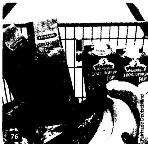
Viele Zahnärzte sehen den Begriff Marketing eher kritisch. Was dahinter steckt, ist jedoch durchaus mit ethischen Ansprüchen vereinbar.