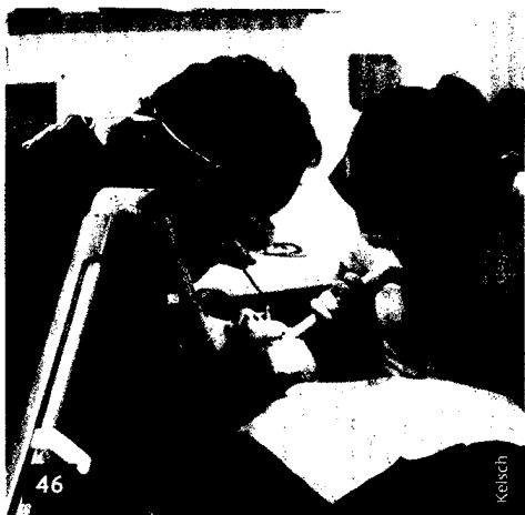
Mit vielen Einsatzgebieten ist der Laser der Allrounder in der Praxis. Rechnet er sich auch?