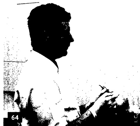
Chronische Leiden des Bewegungsapparates vermeiden – Ergonomie in der Zahnarztpraxis