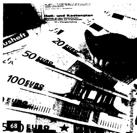
Bewegung beim Thema GOZ: Was kann die neue Urteiledatenbank der BZÄK und wie hilft sie bei der Abrechnung weiter?