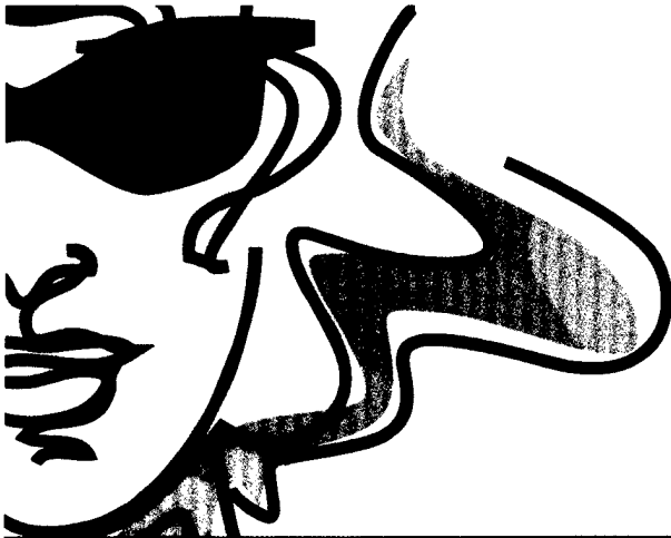
AB SEITE 12: Hertsch verpönt zur AGO-Jubiläumstagung 2016