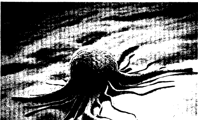
17 Kolorektalkarzinom: Aktuelle ESMO-Empfehlungen