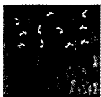
ARS MEDICI 23/15: Giraffen und Vögel (verkauft!)