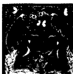
ARS MEDICI 24/15: Affen und Vögel (verkauft!)