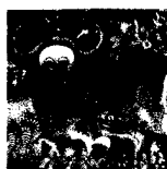
ARS MEDICI 2/16: Büffel (verkauft!)