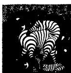
ARS MEDICI 1/16: Zebra (verkauft!)