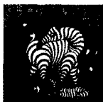
ARS MEDICI 1/16: Zebra