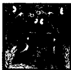
ARS MEDICI 24/15: Affen und Vögel