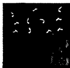
ARS MEDICI 23/15: Giraffen und Vögel (verkauft!)