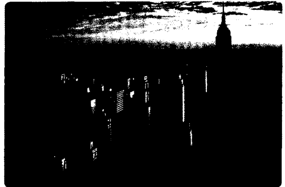
Deutschsprachiger Auftakt beim Nobel Biocare Global Symposium 2016 in New York Seite 30