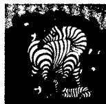
ARS MEDICI 1/16: Zebra (verkauft!)