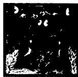
ARS MEDICI 24/15: Affen und Vögel (verkauft!)