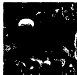
ARS MEDICI 2/16: Büffel