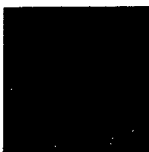
ARS MEDICI 22/15: Fischwirbel (verkauft!)