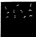
ARS MEDICI 23/15: Giraffen und Vögel (verkauft!)