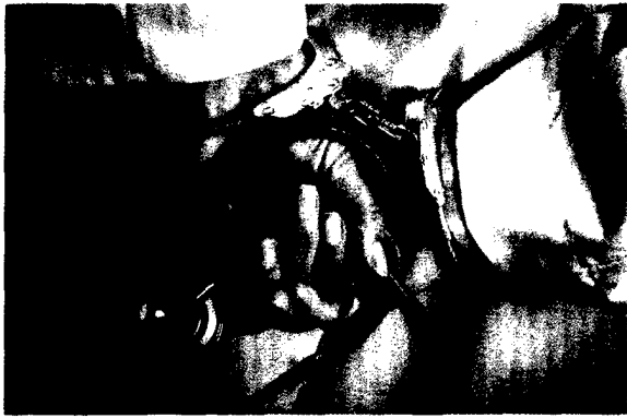
Bringt der neue § 217 Ärzte in die Bredouille?