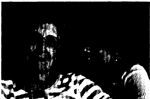
Die DGHS startet ab März 2016 eine Bevollmächtigten-Börse.