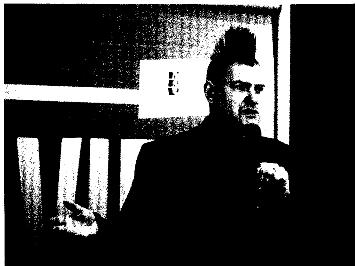
ILLUSTRATION: PHOELUXDE – SHUTTERSTOCK; FOTO: SCHOELZEL: XYZ – SHUTTERSTOCK