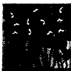
ARS MEDICI 23/15: Giraffen und Vögel (verkauft!)