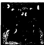
ARS MEDICI 24/15: Affen und Vögel (verkauft!)