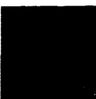
ARS MEDICI 22/15: Fischwirbel (verkauft!)