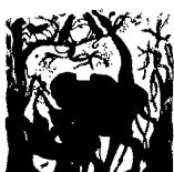
ARS MEDICI 19/16: Elefanten mit Giraffe und Affen (verkauft!)