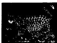
ARS MEDICI 20/16: Leoparden auf Schwarz (verkauft!)