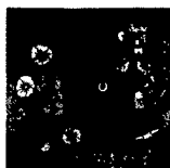
ARS MEDICI 17/16: Gedanken