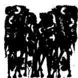
ARS MEDICI 21/16: Giraffen