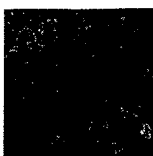
ARS MEDICI 18/16: Perlhühner [verkauft!]