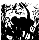
ARS MEDICI 19/16: Elefanten mit Giraffe und Affen [verkauft!]