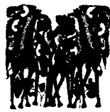
ARS MEDICI 21/16: Giraffen