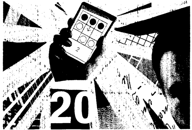
Programme mit Strahlkraft: Stärken und Schwächen von Gesundheits-Apps