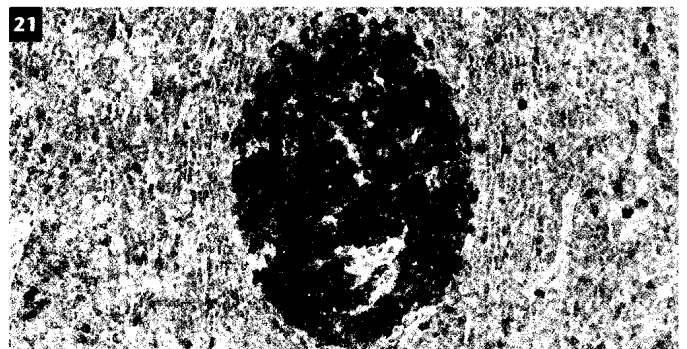
Zentrozyten sind B-Lymphozyten, die im lymphatischen Gewebe vorkommen (hier ein Lymphknoten-Schnittpräparat, immunhistochemische Färbung mit Anti-CD10).