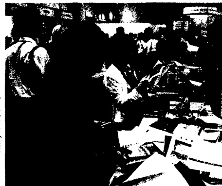
© ESC Congress 2016, International Center for Documentary Arts (ICDA)