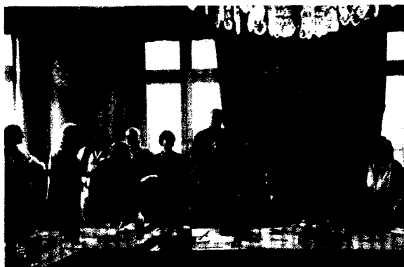
Motivierte Teilnehmer beim Weiterbildungsseminar für Ehrenamtliche.