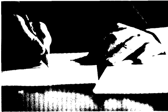
Verschärfte Anforderungen an Patientenverfügungen. Das sagt der Rechtsanwalt dazu.