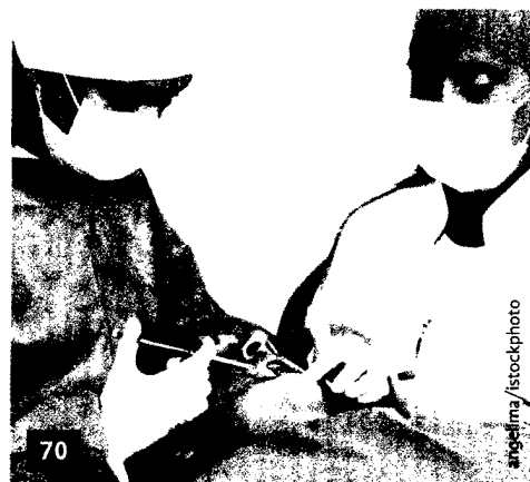
70 GOZ und Endo – Unklarheiten bei Nr. 2439, die die medikamentöse Einlage beschreibt