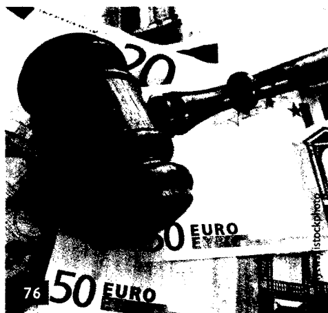
76 Honorare fließen auch bei geringen Mängeln. Aktuelle Urteile schaffen mehr Rechtssicherheit.