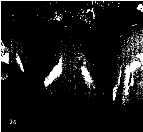
Individuelles Arbeiten ohne vorgefasste Farbstandards liegt im Trend.