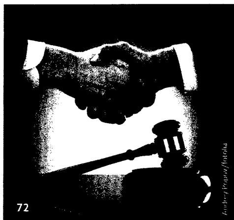
72 Die Aufnahme eines Juniorpartners will durchdacht sein – der BFH sorgt für mehr Klarheit.