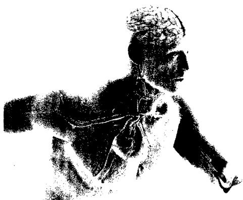
Alle aktuellen DFP-Veranstaltungen auf einen Blick