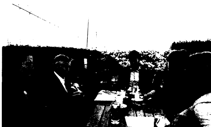
6 Österreichische Experten diskutieren über die Volkskrankheit Diabetes