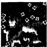
ARS MEDICI 14+15/16: Löwen (verkauft!)