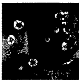
ARS MEDICI 17/16: Gedanken