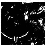
ARS MEDICI 13/16: Arche Noah (verkauft!)