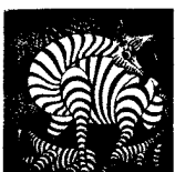
ARS MEDICI 16/16: Zebras (verkauft!)