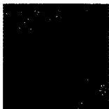
ARS MEDICI 18/16: Perlhühner (verkauft!)