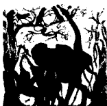
ARS MEDICI 19/16: Elefanten mit Giraffe und Affen (verkauft!)