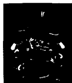
ARS MEDICI 10/15: Vögel auf schwarz (verkauft!)