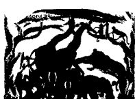
ARS MEDICI 14+15/15: Tiere auf Braun (verkauft!)