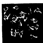
ARS MEDICI 16/15: Vögel auf Blau