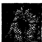
ARS MEDICI 12/15: Geparden (verkauft!)