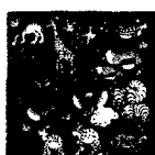
ARS MEDICI 11/15: Tiere (verkauft!)