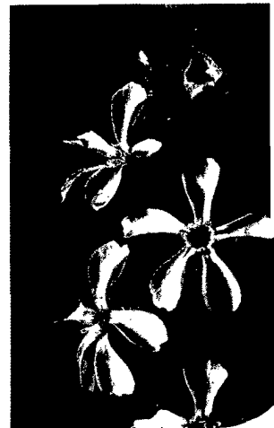
Titelfoto: Gewöhnliches Seifenkraut ( Saponaria officinalis )