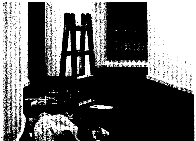
ILLUSTRATION: INA BUNGE

Die Wirkung von hochwertiger Innenarchitektur im Gesundheitswesen ist ein wichtiger Imageträger und daher niemals zu unterschätzen. Tipps für die Renovierung Ihrer Arztpraxis. Seite 38