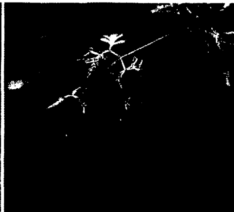
Zustand nach Schilddrüsen-Operation - Monika Liewers