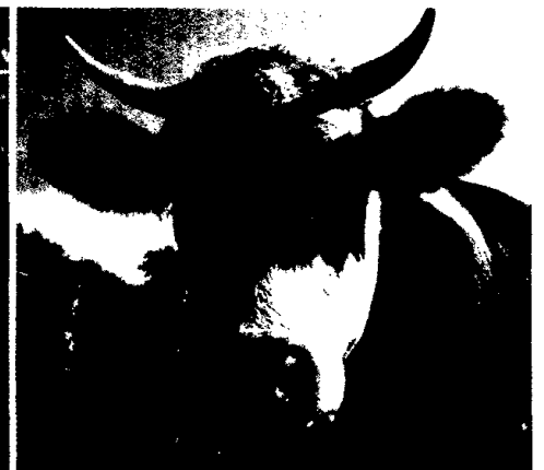
Mastitis beim Rind - Sybille Maurer