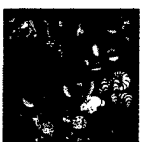
ARS MEDICI 11/15: Tiere