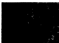
ARS MEDICI 13/15: Chamäleons