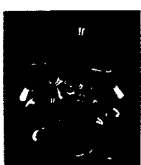
ARS MEDICI 10/15: Vögel auf schwarz