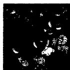
ARS MEDICI 11/15: Tiere (verkauft!)