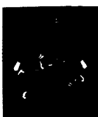
ARS MEDICI 10/15: Vögel auf schwarz (verkauft!)