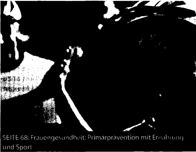
SEITE 68: Frauengesundheit: Primärprävention mit Ernährung und Sport