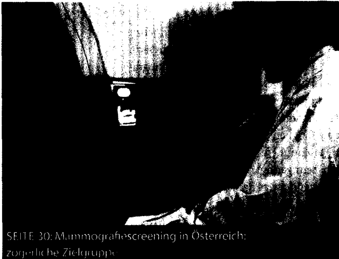
SEITE 30: Mammografiescreening in Österreich: zogenetische Zielgruppe