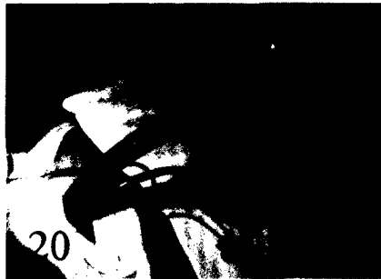
Die Sekretabsaugung hilft, eine beatmungsassoziierte Pneumonie zu vermeiden